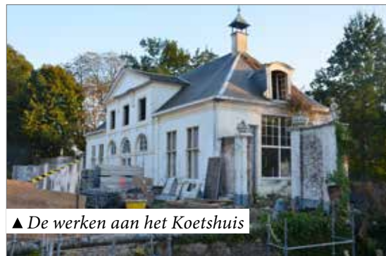
▲ De werken aan het Koetshuis

elkaar beter leren kennen, plaatsen waar mensen ideeën uitwisselen, plaatsen waar ideeën ontstaan, plaatsen waar mensen zich