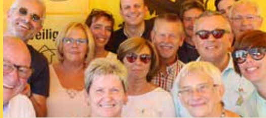
N-VA Edegem in beeld (p. 2)