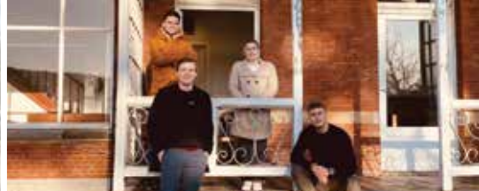
Jong N-VA in 2022: een jaar boordevol activiteiten (p. 5)