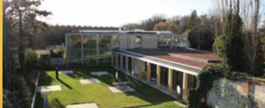
VTC Kruispunt genomineerd voor internationale prijs (p. 2)