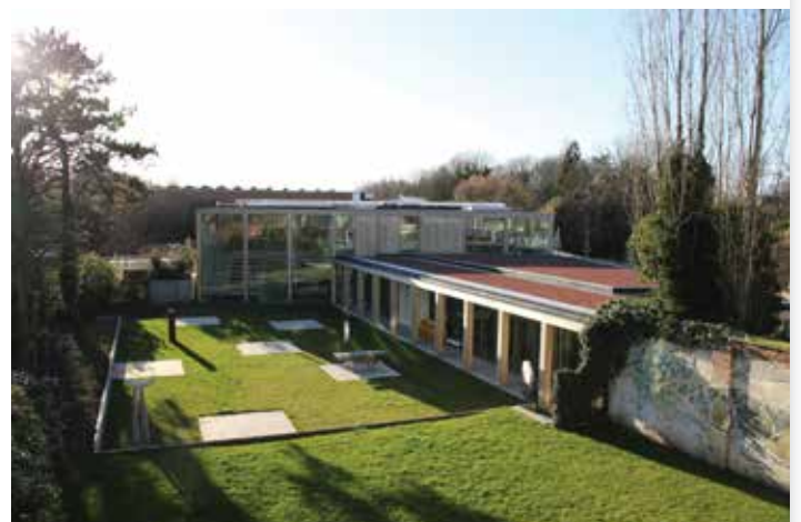
▲ De duurzame houtskeletbouw van ons nieuwe vrijetijdscentrum valt internationaal in de smaak.