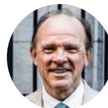
Philippe Muylers Vlaams Parlementslid

Ook ons OCMW ontvangt de komende jaren 65.000 euro extra Vlaamse steun om mensen te helpen die het echt moeilijk hebben. Nodige en nuttige maatregelen, die ik ten volle steun in het Vlaams Parlement.