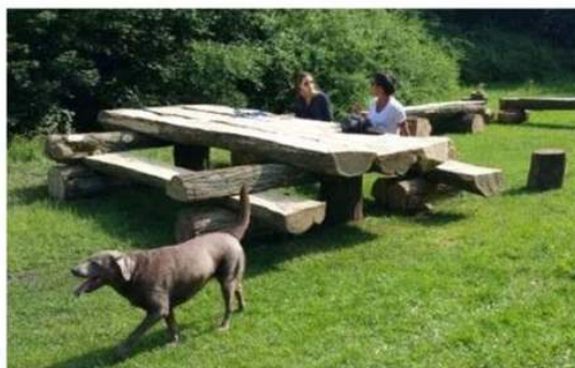
Op de houten banken kunnen de ouders in alle rust ontspannen.