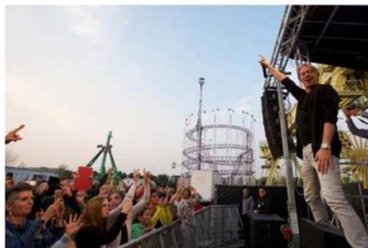
Regi lokte veel volk naar Spoor Oost.