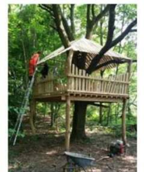
De boomhut werd gebouwd door de gemeentediensten.